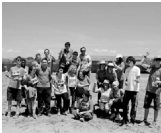
Los alumnos de Educación Especial, en el podio. PABLO SEGURA