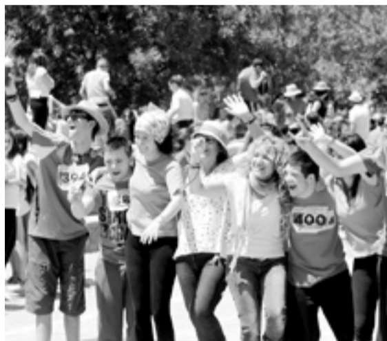
Alumnos y profesores de Educación Especial. PABLO SEGURA