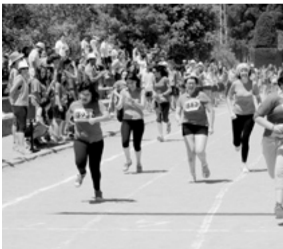
Carrera femenina del aula de Educación Especial. PABLO SEGURA